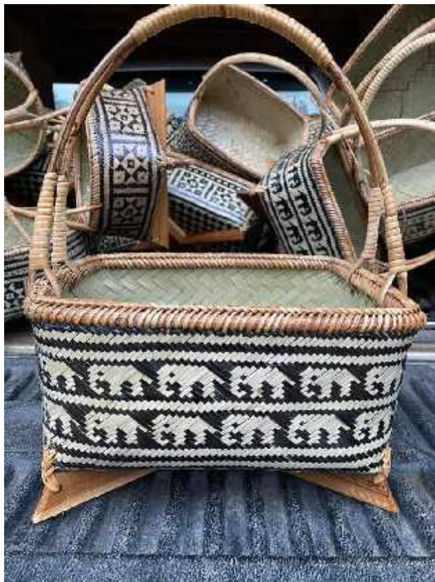
ก่องข้าว