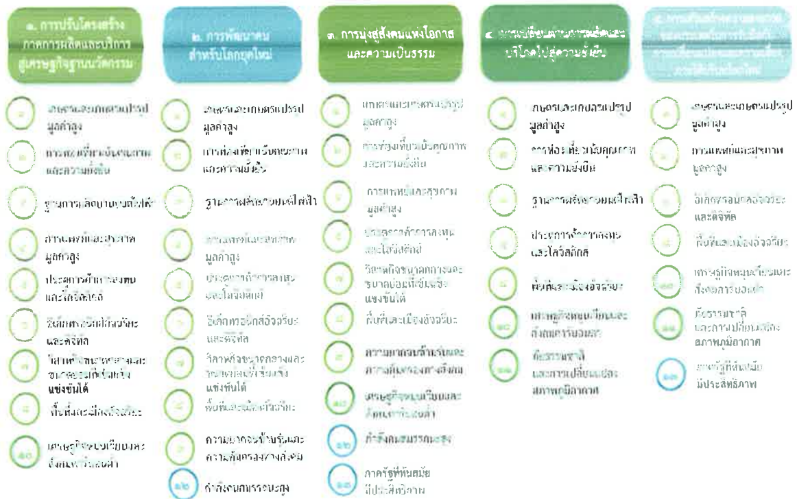
แผนภาพที่ ๓.๑ ความเชื่อมโยงระหว่างพัฒนาการพัฒนาด้านเป้าหมายหลัก

ความเชื่อมโยงระหว่างหมวดหมู่การพัฒนา กับเป้าหมายหลักแสดงไว้ในแผนภาพที่ ๓.๑ โดยหมวดหมู่การพัฒนาที่กำหนดขึ้นเป็นประเด็นที่มีลักษณะเชิงบูรณาการที่ครอบคลุมการพัฒนา ตั้งแต่ในระดับต้นน้ำจนถึงปลายน้ำ และสามารถนำไปสู่ผลพัฒนา ทั้งในมิติเศรษฐกิจ สังคม ทรัพยากรธรรมชาติและสิ่งแวดล้อมไปพร้อมๆ กัน ทำให้หมวดหมู่แต่ละประการ สามารถสนับสนุนเป้าหมายหลักได้มากกว่าหนึ่งข้อ นอกจากนี้การพัฒนาภายใต้แต่ละหมวดหมู่ไม่ได้แยกขาดจากกัน แต่มีการสนับสนุนหรือเอื้อประโยชน์ซึ่งกันและกัน